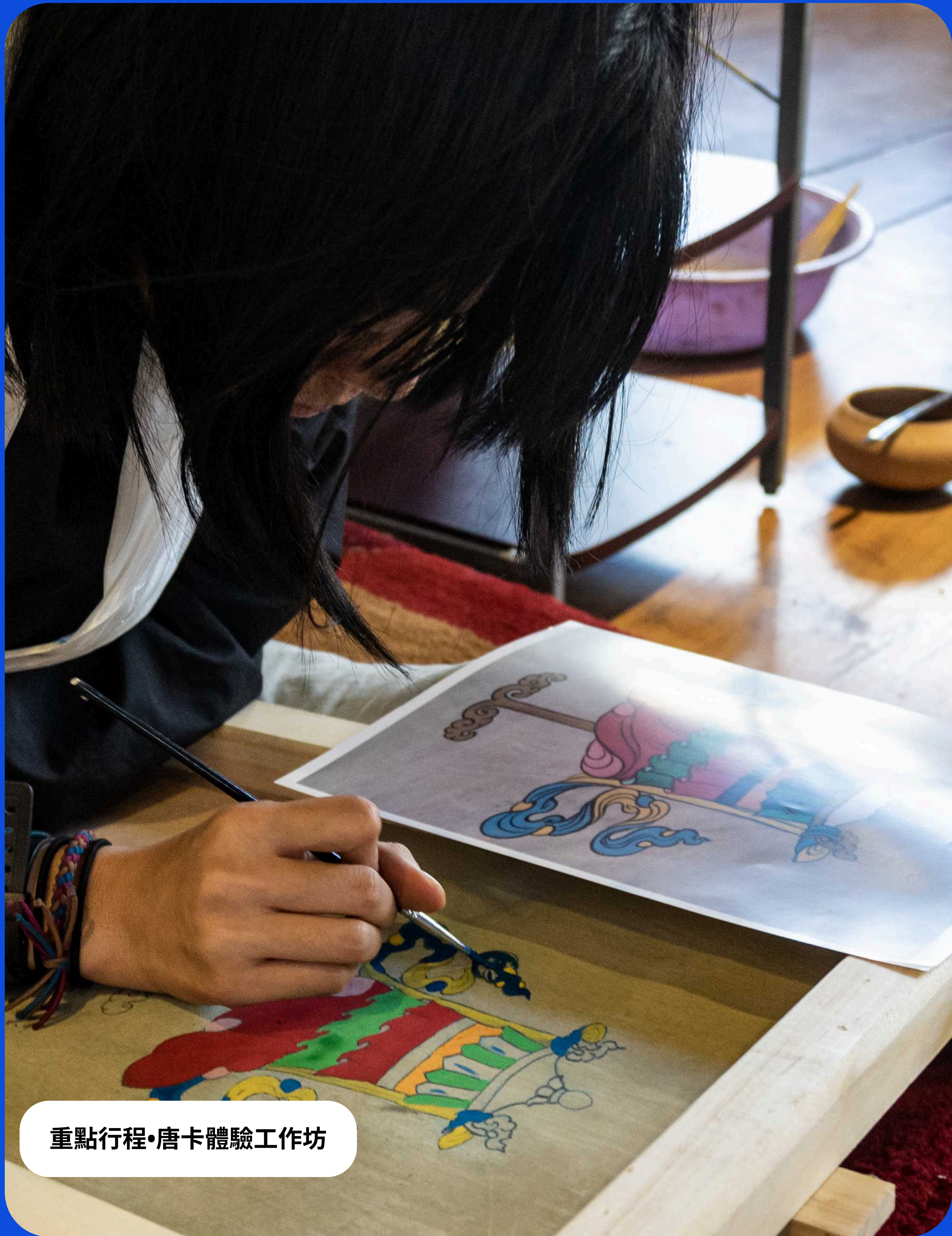
重點行程•唐卡體驗工作坊